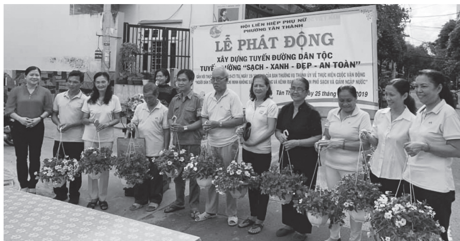
Một số hộ dân phường Tân Thành được tặng cây xanh tại lễ phát động xây dựng tuyến đường Dân Tộc “sạch - xanh - đẹp - an toàn”.

UBND phường thống nhất xây dựng mô hình 4 tuyến đường, 5 tuyến hẻm tự quản “sạch - xanh - đẹp và an toàn” với 5 tiêu chí thực hiện cụ thể.