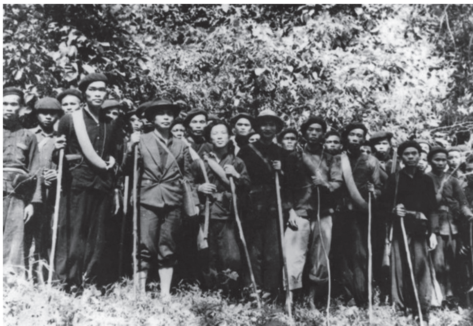
34 đội viên đầu tiên của Đội Việt Nam Tuyên truyền Giải phóng quân.

Luôn nhớ đến phương châm hoạt động là “chính trị trọng hơn quân sự, tuyên truyền trọng hơn tác chiến”, sau mỗi trận đánh cán bộ và chiến sĩ đều tận dụng thắng lợi để mở rộng công tác tuyên truyền. Từ đó, chiến thắng quân sự phục vụ đắc lực nhiệm vụ chính trị, góp phần đẩy mạnh phong trào cách mạng. Nhiều địa phương thành lập các đội tự vệ, du kích, nhân dân sôi nổi tham gia các hội cứu quốc, bọn phản động hoang mang lo sợ. Đại đội chủ động bàn với Liên tỉnh ủy vạch một kế hoạch mở rộng tuyên truyền đi đôi với mở rộng tổ chức cơ sở chính trị và lực lượng vũ trang.